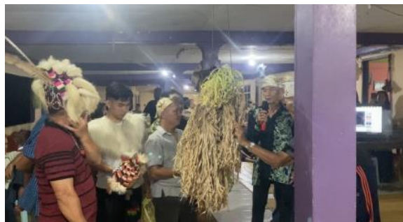
Rajah 10: Sesi menghantar 'kuhong' kembali ke tempatnya. (Emalisa Telun Domian, 2022)

Selepas semua proses untuk ritual Ngayo telah dilaksanakan, keesokan harinya semua penduduk kampung pergi 'kuman bahek' iaitu makan beramai-ramai di tebing ungai dengan kata lainnya piknik beramai-ramai. Mereka memanggil proses ini sebagai 'pusang'. Semua penduduk kampung akan membawa saki baki makanan mereka sepanjang hari perayaan seperti kuih muih, selupi (nasi yang dibungkus dalam daun), selukong (sama macam ketupat), air manis dan tuak untuk dimakan bersama-sama. Sebelum mereka memulakan aktiviti mandi manda dan panggang memanggang, beberapa orang lelaki akan mengikat semua Daun Sang yang dibawa bersama mereka sepanjang ritual Ngayo hari sebelumnya menjadi satu ikatan yang ungai. Kemudian ikatan Daun Sang ini akan diikat merentangi sungai tempat mereka berpiknik. Setelah itu, Guru Bungan akan menjalankan tugasnya yang terakhir untuk upacara itu dengan mengangkat segelas tuak dan menyampaikan doa juga pesanan kepada Doh Tenangan seperti ditunjukkan pada Rajah 11, mereka telah selesai meraikan hari perayaannya dan selesai melakukan persembahan ritual Ngayo, kini mereka bersedia untuk pergi ke fasa seterusnya kemudian meminta agar Doh Tenangan sentiasa memberkati mereka dalam apa jua perkara mereka lakukan. Selepas selesai menyampaikan doa, Guru Bungan mencurahkan air tuak tersebut ke tanah dan ungai sebagai tanda dia memberi minum kepada semangat yang ada disitu. Selepas itu, barulah mereka memulakan aktiviti bersuka ria mereka.