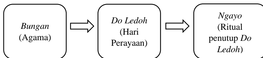
Rajah 2: Rumusan Konsep Upacara Adat Agama Bungan

The presence of the jungle path from the Krokong Road to the bridge proved that the villagers were still using it, so it followed that more information should be available in Kpg Seropak. So, one day in December 2007, we headed out to meet the headman of Kpg Seropak.