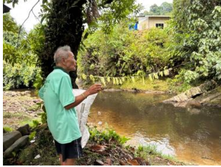
Rajah 11: Guru Bungan menyampaikan pesanan 'pusang'. (Emalisa Telun Domian, 2022)

Selesai aktiviti 'pusang' tersebut, maka upacara perayaan Do Ledoh sudah berakhir. Hal ini kerana, upacara 'pusang' adalah proses terakhir dalam ritual upacara agama Bungan. Ini juga sebagai tanda bahawa mereka telah selesai bersusah payah sepanjang tahun ini menanam padi, kini mereka boleh berehat seketika sebelum memulakan dengan padi baru lagi. Sehubungan dengan itu, peranan Guru Bungan dapat dilihat dengan jelas sepanjang hari perayaan Do Ledoh dan sewaktu proses pelaksanaan upacara persembahan ritual Ngayo sewaktu hari perayaan tersebut. Jadual 2 di bawah menunjukkan ringkasan peranan Guru Bungan sewaktu pelaksanaan upacara persembahan ritual Ngayo tersebut.