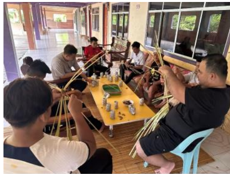
Rajah 5: Para lelaki sedang menganyam Daun Sang. (Emalisa Telun Domian, 2022)

Sewaktu Guru Bungan mengangkat telur untuk menyampaikan pesan kepada Doh Tenangan, Guru Bungan menyampaikan pesan kepada para lelaki di setiap rumah untuk membuat persediaan mengikuti ritual ini. Mereka akan menyiapkan pakaian mereka di luar dan juga menganyam Daun Sang iaitu Daun Kurma seperti yang digambarkan di Rajah 4. Daun ini telah dicari sehari sebelum upacara ritual Ngayo untuk dibawa sekali sepanjang pelaksanaan ritual tersebut.