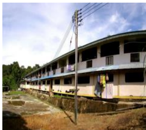
Rajah 1: Penempatan Baru kampung Long Amo Selepas Berpindah.